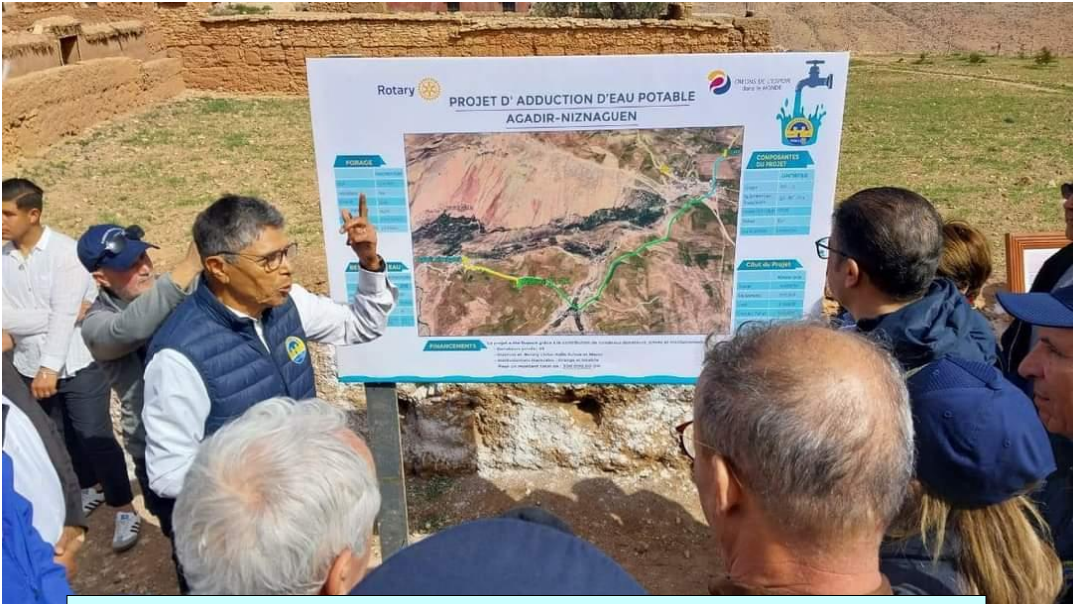
2 March 2024 - Agadir-Niznaguen (Morocco) - Inauguration ceremony of wells and drinking water supply pipelines