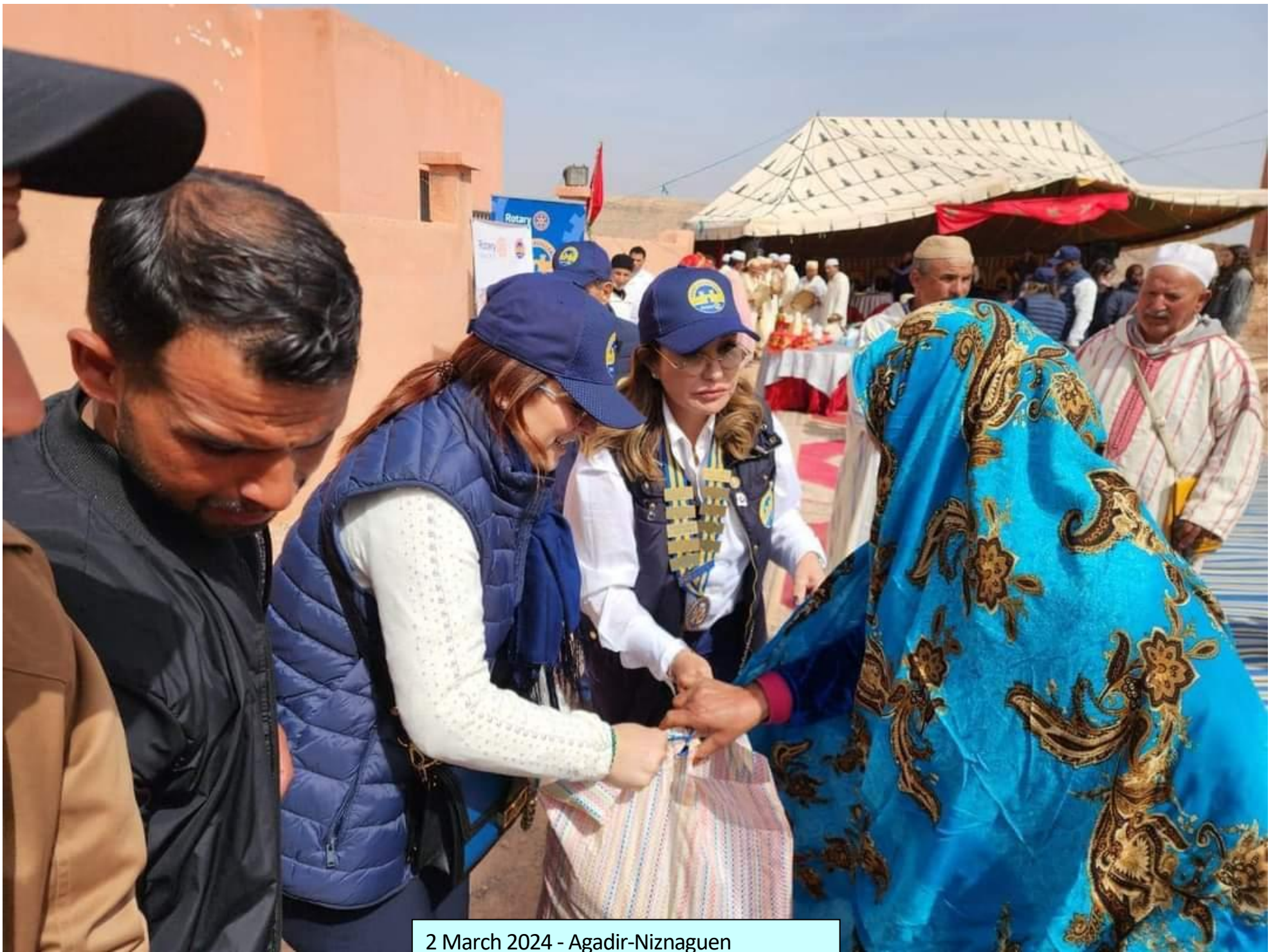
2 March 2024 - Agadir-Niznaguen