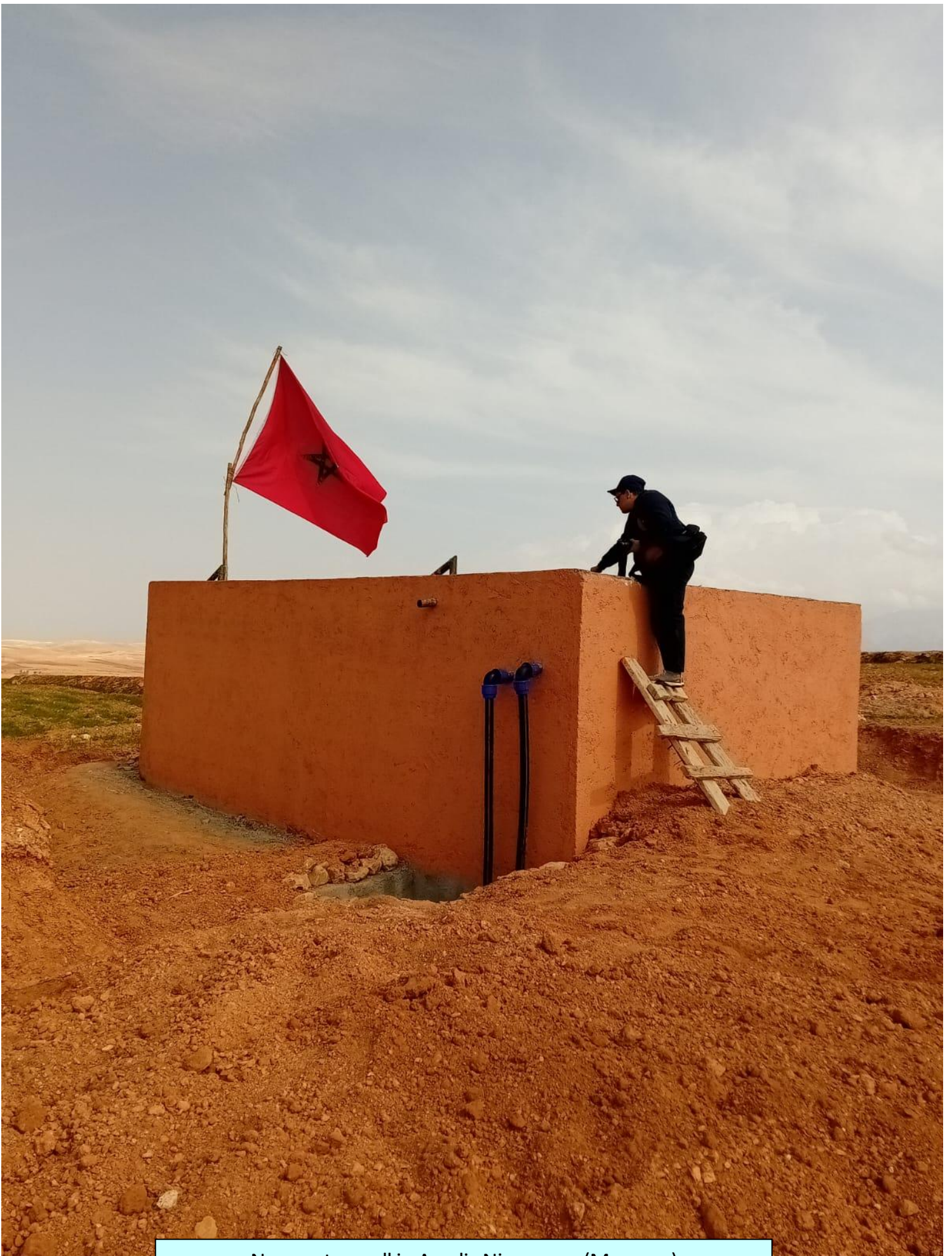
New water well in Agadir-Niznaguen (Morocco)