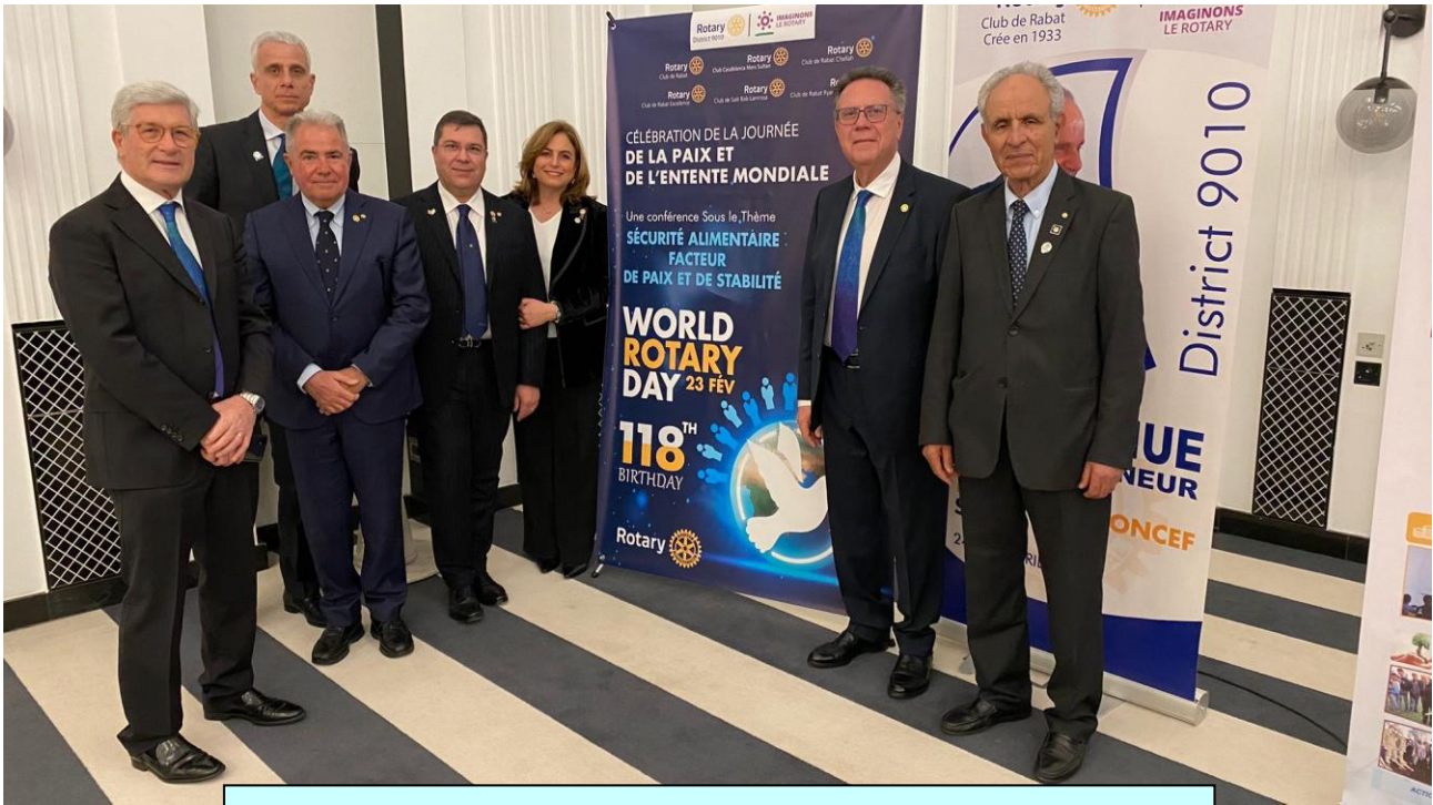
23 February 2023 - Rabat (Morocco) - World Rotary Day Celebration