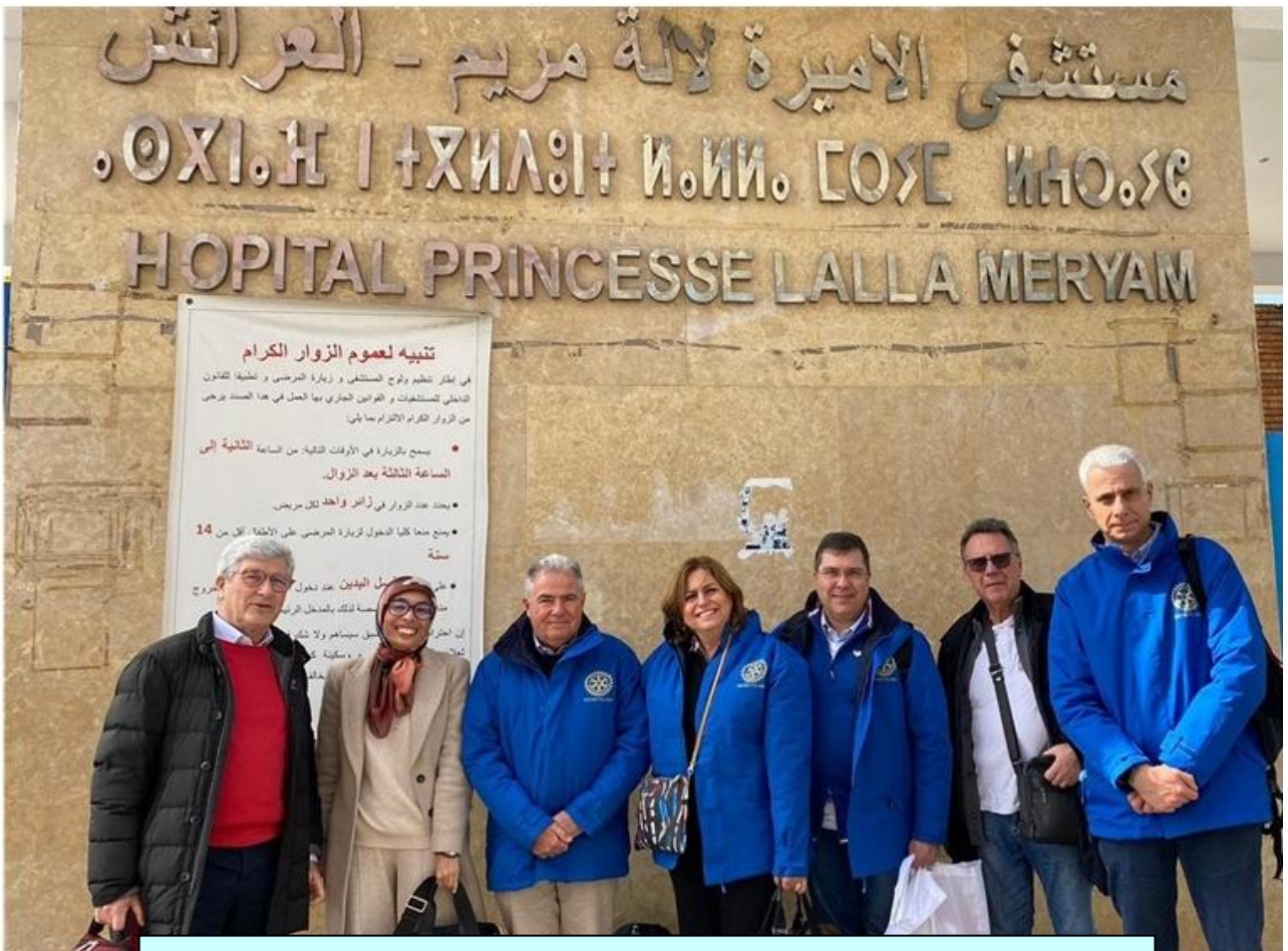
February 2023 - Larache (Morocco) - Vocational Training Team VTT) of the Rotary Districts 2110 and 2080 in Morocco for the Global Grant finalized to the creation of the “Centre for the Diagnosis and Therapy of Thalassemia” at the “Lalla Meriem” Hospital in Larache