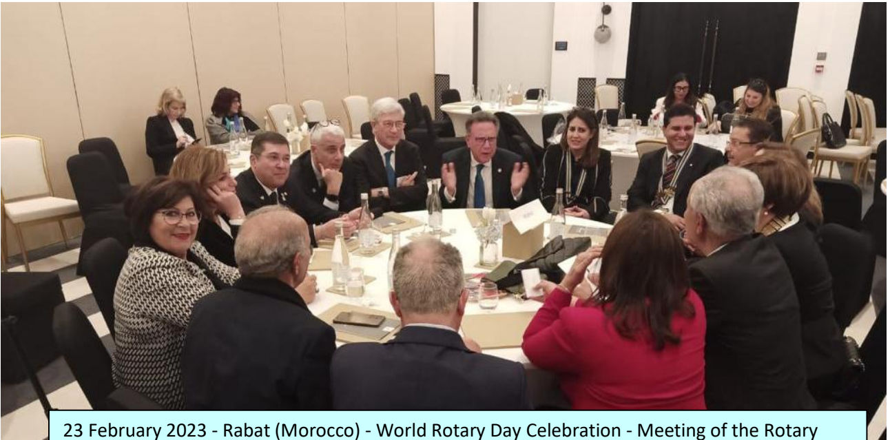
23 February 2023 - Rabat (Morocco) - World Rotary Day Celebration - Meeting of the Rotary Inter-Country Committees Italy, Malta, San Marino and Morocco